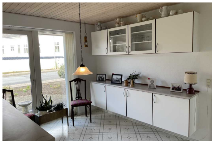
Køkken / alrum