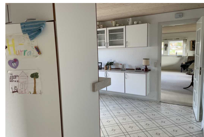
Køkken / alrum