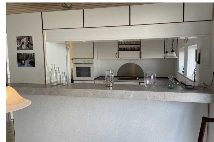
Køkken / alrum