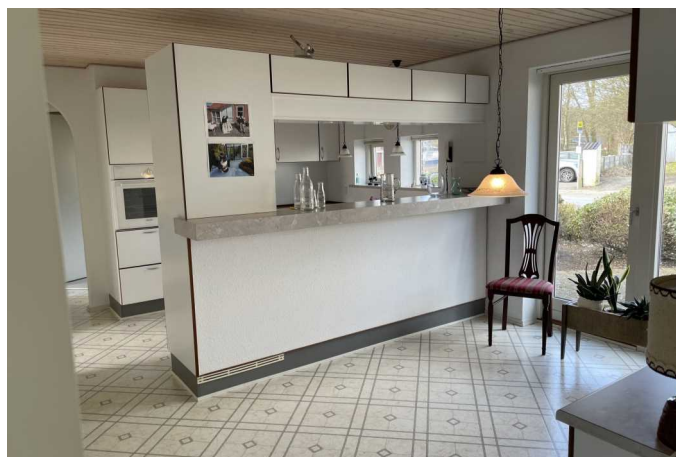
Køkken / alrum